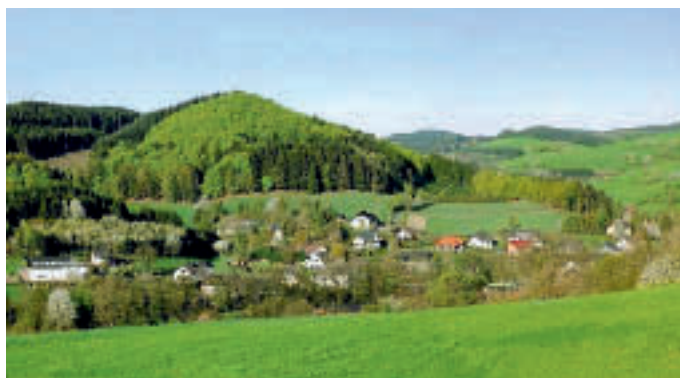
Leitideen gesucht: Referinghausen im Hochsauerlandkreis ist Schauplatz des Sommerseminars 2011 der Stiftung Deutscher Architekten.

Das Spektrum der Aufgaben reicht von architektonischen Lösungen für brachgefallene Grundstücke bis hin zu Ideen zur Gestaltung des öffentlichen Raums und zur Lösung von Verkehrsproblemen. Selbst künstlerische Aspekte an der Schnittstelle zwischen Landschaft und Dorf lassen sich denken. Erlaubt ist auch die Frage, ob der Tourismus einziger Motor zur Stabilisierung des ländlichen Raums sein kann. Referinghausen liegt mit seinen 252 Einwohnern im Hochsauerlandkreis, etwa 15 km nord-östlich von Winterberg. Als einer von neun Ortsteilen gehört Referinghausen zur Stadt Medebach mit insgesamt 8000 Einwohnern. Dieser Landstrich steht wie viele andere ländliche Regionen gegenwärtig vor großen Herausforderungen.