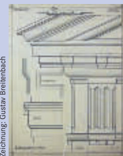
Zeichnung: Gustav Breitenbach

Die Ausstellung „Querschnitt“ zeigt über 30 historische Blätter, die aus der