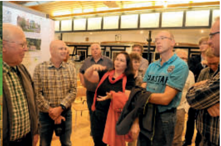
Die 254 Einwohner des Ortes Referinghausen zeigten sich äußerst interessiert und kamen jeden Tag zum Austausch mit den Seminarteilnehmern zusammen. An dem Auftakt am 9. September 2011 nahmen mehr als 200 Seminarteilnehmer und Gäste aus Referinghausen teil. Auch zur Abschlusspräsentation kamen weit über 100 Interessierte zusammen.