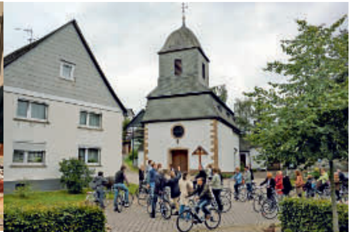
„Rast in REF“? Ein Vorschlag empfahl die Entwicklung eines attraktiven Rastplatzes für Wanderer und Biker, Tagestouristen und Radfahrer