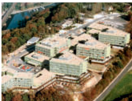
Krankenhausplanungen als roter Faden in Rosinys Werk: Die Fachklinik Rhein-Ruhr in Essen

Neben zahlreichen Kirchen und Gemeindezentren zieht sich die Planung von Kranken-