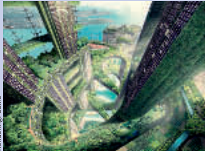
Vertikale Städte, Entwurf von WOHA Architects aus Singapur

Deutsches Architektur Museum, Schaumainkai 43 (2. Dezember 2011 bis 29. April 2012)