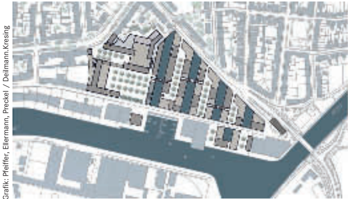
Grafik: Pfeiffer, Ellermann, Preckel / Deilmann, Kresing

Masterplan Hansazentrum Neuhafen in Münster: Nutzungskonflikte zwischen Feiern und Wohnen