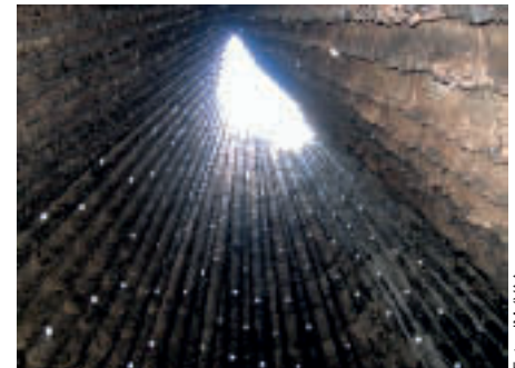
Impression vom Inneren der Kapelle