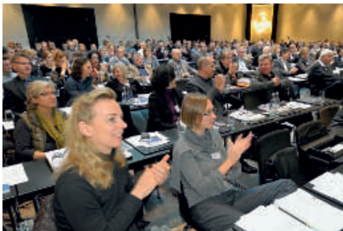
57. VVS in Düsseldorf: Intensive Diskussion um die Entwicklung des Berufsbildes und um aktuelle berufspolitische Fragen