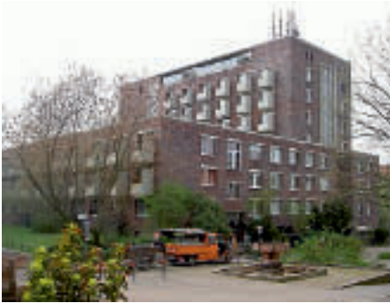
Ledigenhaus Darmstadt, 1952/55

tierte, im Nebel liegende Verdacht möglicher Machenschaften zur Zeit des Dritten Reiches, in den Neufert aufgrund seiner Zusammenarbeit mit Albert Speer in Berlin geriet, mag – aus heutiger Sicht ein nicht nachvollziehbarer – Grund dafür gewesen sein, dass eingehende Untersuchungen seines Lebens und Werkes aus einer anderen Perspektive noch ausstehen.