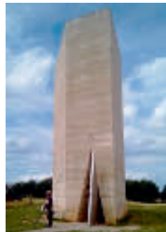
Wachendorfer Feldkapelle von Peter Zumthor

Ein hiesiger Bauer hatte aus Dankbarkeit für ein gutes und erfülltes Leben den bekannten Schweizer Architekten Peter Zumthor angesprochen, ob er seiner Familie nicht eine Kapelle auf seinem eigenen Feld entwerfen möge. Sicherlich war die Verbindung zu dem Landsmann und Heiligen Nikolaus von Flüe