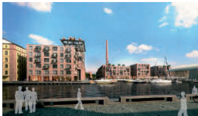
Rendering: Pfeiffer, Ellermann, Preckel / Deilmann.Kresing

Waren es in der Vergangenheit vor allem „Medienhäfen“, „Kreativkai“ und Ausgeviertel, die die Vision einer modernen Dienstleistungsstadt mit Entspannungsqualitäten umzusetzen suchten, so setzt sich nun, das zeigen die Beispiele, ein anderer Trend durch: Die Tendenz geht in Richtung eines Wohnens, das vor allem eine Qualität zum Ausdruck bringt: Allen Krisen zum Trotz – es geht in Richtung gehobener