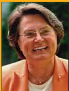
Christa Thoben Ministerin für Wirtschaft, Mittelstand und Energie des Landes Nordrhein-Westfalen

Im Gegenteil: Wärmepumpen bieten zusätzlich bemerkenswerte Vorteile. Wärmepumpen setzen zu einem großen Teil Umweltwärme gewinnbringend ein und benötigen nur einen kleinen Anteil an Strom für den Antrieb. Der Anteil der Umweltwärme an der für ein Gebäude erforderlichen Heizenergie kann bis zu 80 % betragen. Das reduziert die CO 2 -Emissionen um mehr als 30 % und senkt die Heizkosten um über 50 %. Diese Zahlen verdeutlichen, welchen Stellenwert die Wärmepumpe einnehmen könnte; mit positiven Auswirkungen auf die Umwelt und Klima, den privaten Verbraucher und auch auf unsere Volkswirtschaft.