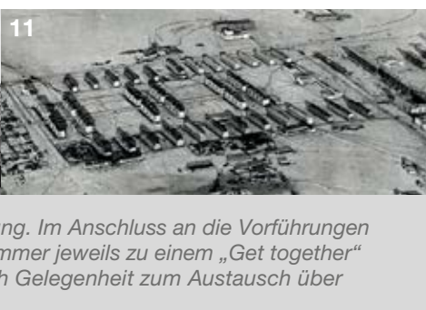
1+2: The Novgorod Spaceship 3+4: Hotel Jugoslavija 5-7: Fort von allen Sonnen 8+9: Das Haus der Regierung 10+11: Sotsgorod: Cities for Utopia

Alle Filme mit Einführung. Im Anschluss an die Vorführungen lädt die Architektenkammer jeweils zu einem „Get together“ im Foyer, bei dem sich Gelegenheit zum Austausch über das Programm bietet.