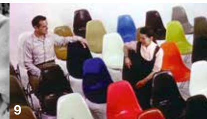
1+2: Eero Saarinen – The Architect who saw the Future 3+4: Peter Behrens – Vom Skizzenblock zum Alexanderplatz 5: Umbautes Licht – Manifeste der Industriearchitektur 6+7: Rams 8+9: Eames - The Architect and the Painter