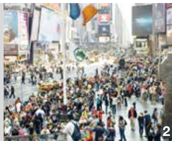
1+2: The Human Scale 3+4: Das süße Leben 5+6: Urbanized 7+8: Tatis Schützenfest